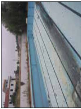
FOTOGRAFIA - 2