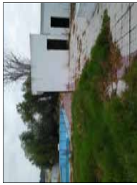
FOTOGRAFIA - 6