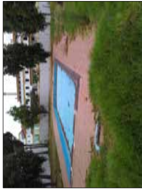
FOTOGRAFIA - 3