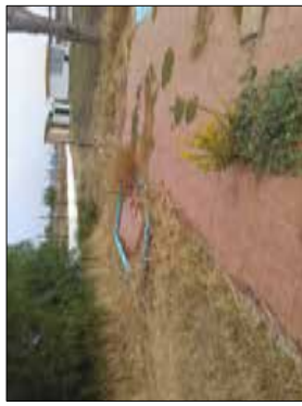
FOTOGRAFIA - 4