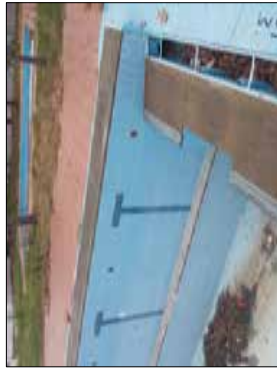
FOTOGRAFIA - 5