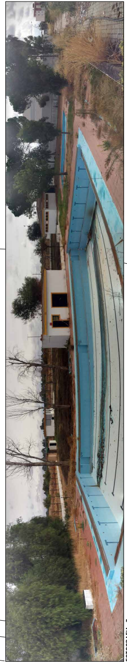
FOTOGRAFIA - 7