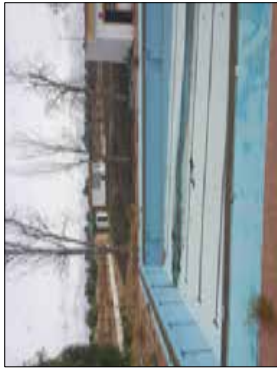
FOTOGRAFIA - 1